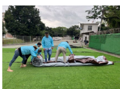
10. Göngyöljük össze a szerkezetet.