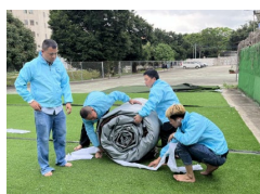
11. A kötelet helyezük a csomagok alá.