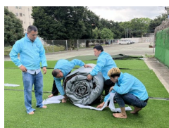
11. A kötelet helyezük a csomagok alá.