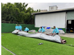
7. A szemben lévő lapokat hajtsuk egymásra.