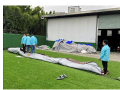
8. Előre-hátra járva rajta, préseljük ki a levegőt.