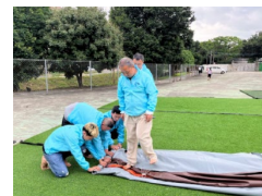
9. Egy személy lábával kinyomja az utolsó levegőmaradékot is.