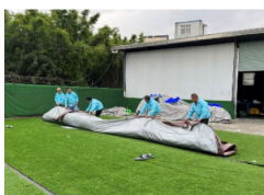
7. A szemben lévő lapokat hajtsuk egymásra.