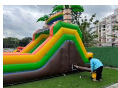
2. Állítsuk le a fúvóberendezést.