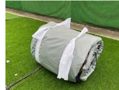
12. Kössük össze a kötelet.