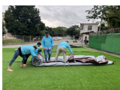
10. Göngyöljük össze a szerkezetet.