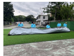
6. A lapokat hajtsuk egymásra.