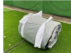
12. Kössük össze a kötelet.