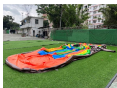
5. Leeresztve hagyjuk megszáradni.