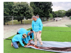
9. Egy személy lábával kinyomja az utolsó levegőmaradékot is.