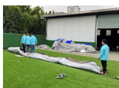
8. Előre-hátra járva rajta, préseljük ki a levegőt.