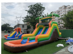
1. Fontos, hogy senki ne legyen a közelben